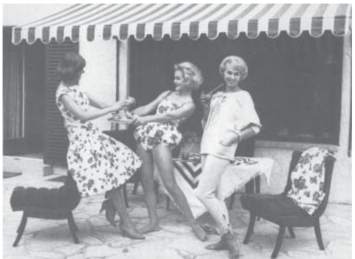
Мода, мода, мода...

В годы войны было разрушено более 20% домов, тогда как численность населения ФРГ из-за большого притока переселенцев и беженцев возросла до 51 млн. человек, т.е. на 1/5. Согласно статистике, в 1950 г. на 3 семьи приходилось 2 квартиры, только около 1/2