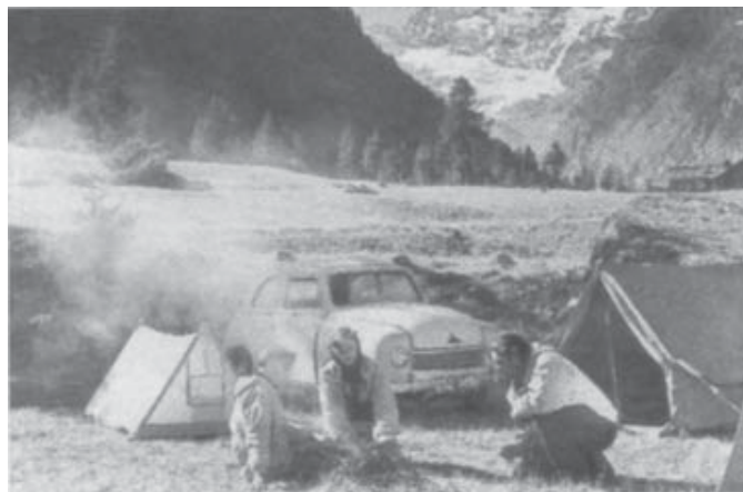
Отпуск в Италии