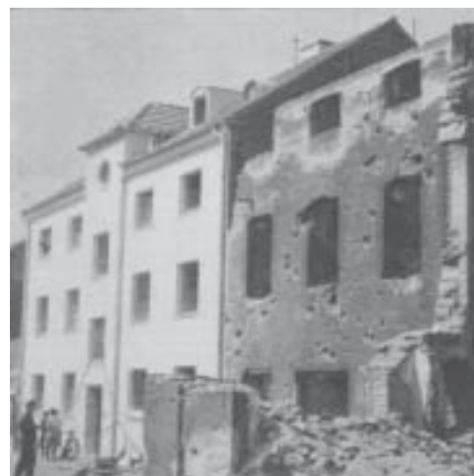
Сначала восстанавливали старое...

50-е годы были временем изнурительного труда, но все же в трудовой сфере в это время произошли заметные изменения. За 10 лет число занятых в экономике выросло с 4,5 до 26,5 млн. человек. Безработица за то же время сократилась с 9% до 1,3% – в конце 50-х годов царил практически