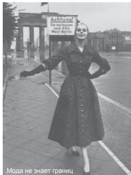
Мода не знает границ

длительного пользования. Степень оснащенности такими товарами постепенно нарастала. Если в 1953 г. лишь 9% семей имели холодильник и 26% – пылесос, то уже к 1963 г. соответственно 52% и 65%. Также обстоит дело и с