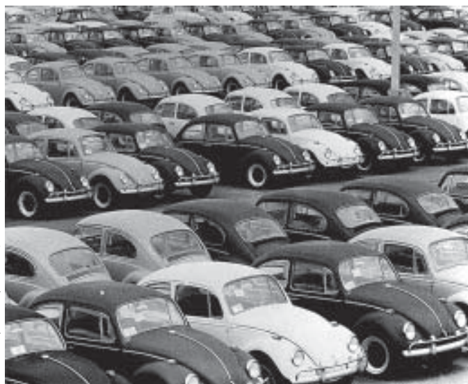
Символ «экономического чуда»

Более половины лиц, получивших работу, составляли женщины; их доля среди занятых увеличилась с 4,3 до 6,8 млн. человек (т.е. на 60%). В 1967 г. уже 37% всех работающих составляли женщины. Молодежь также в значительной мере была вовлечена в трудовую деятельность. В